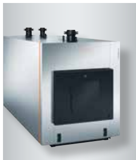
Chaudière gaz à condensation Vitocrossal 300

La technique à condensation élaborée permet d'utiliser la Vitocrossal 300 comme chaudière économique dans de nombreuses applications.