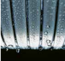
Inox-Radial-warmtewisselaar – duurzaam en efficiënt

Het condensatiewandtoestel op gas Vitodens 050-W biedt hoog verwarmings- en tapwatercomfort en een bijzonder gunstige prijs-/prestatieverhouding.