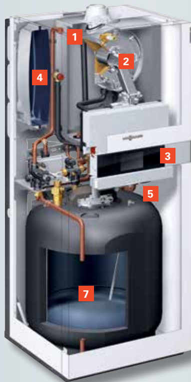
Vitodens 222-F met geëmailleerde laadboiler (type B2TB)