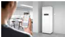
5 inch touchscreen-kleurendisplay van de Vitotronic 200-regeling (type HO2B)