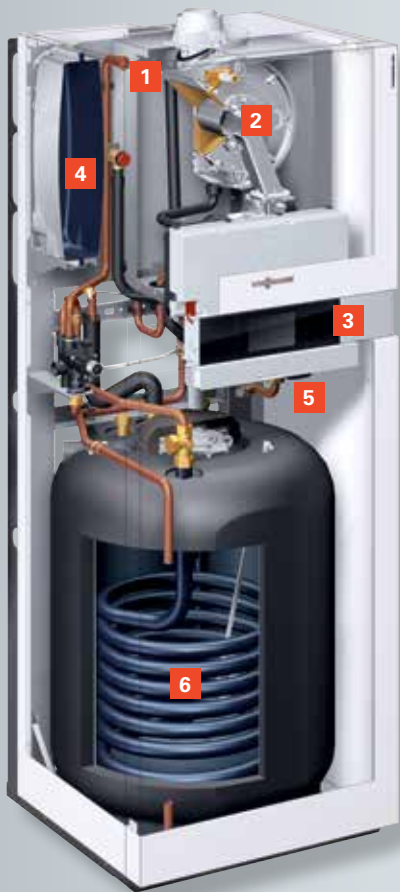
Vitodens 222-F met geëmailleerde spiraal-warmwaterboiler (type B2SB) voor gebieden met een hoge waterhardheid