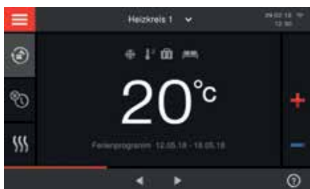
Vitotronic regeling met touchscreen-kleurendisplay