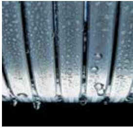
Inox-Radial-warmtewisselaar – duurzaam en efficiënt