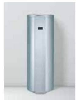
Vitocal 262-A Types T2E/T2H