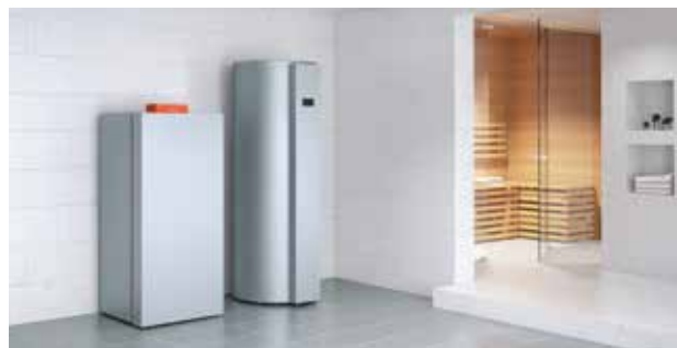
Gascondensatieketel Vitocrossal 300 (links) met warmtepompboiler Vitocal 262-A (type T2H)

Deze productreeks is nu aangevuld met de nieuwe warmtepompboiler-wandmodule Vitocal 262-A (type T2W). De wandmodule is gebaseerd op het uitermate efficiënte koelcircuit van de Vitocal 262-A. Ze werd ontworpen voor de verwarming van de bestaande warmwaterboiler (inhoud 160 tot 500 liter) en is vooral geschikt voor plaatsing in krappe ruimten.