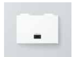
Vitocal 262-A wandmodule Type T2W