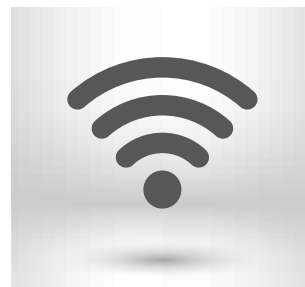
WiFi Beheer op afstand van de lucht/lucht-warmtepomp (optioneel bij het Eco-gamma)