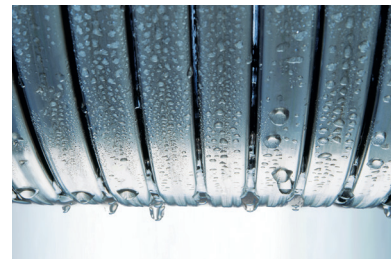
Inox-Radial-warmtewisselaar – duurzaam en efficiënt

De Vitoflame 300 unit blauwe vlambrander is geschikt voor alle gangbare types stookolie en garandeert een bijzonder schone, milieuvriendelijke en efficiënte verbranding.