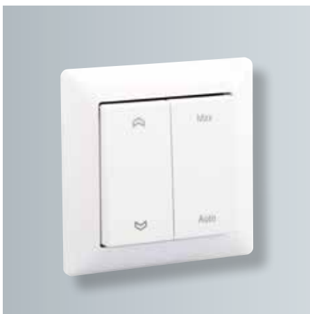
Mooi vormgegeven RF-bedieningsschakelaar