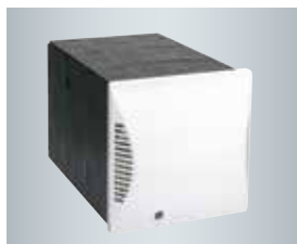
Vierkante wandhuls met buitenafdekplaat

Het compacte woningventilatietoestel Vitovent 200-D wordt gebruikt voor een gecontroleerde ver- en ontluchting van afzonderlijke ruimtes.