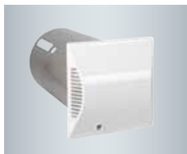
Ronde wandhuls met buitenafdekplaat