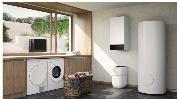
Lucht/water-warmtepomp Vitocal 200-S met daaronder een Vitoset Aqua wateronthardingsinstallatie