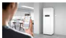
Écran couleur tactile 5 pouces de la régulation Vitotronic 200 (Type HO2B)