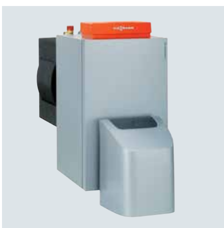
Vitorondens 200-T dans la plage de puissance de 67,6 à 107,3 kW