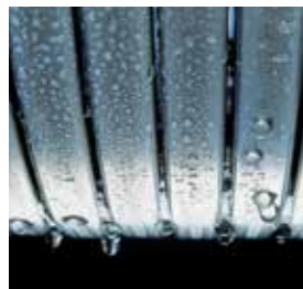
Echangeur de chaleur Inox-radial – durable et efficace