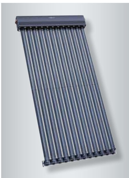
Capteur à tubes sous vide et à haut rendement Vitosol 300-TM (type SP3C)