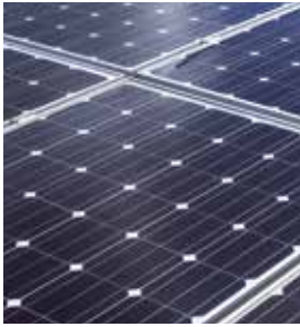
Module photovoltaïque monocristallin Vitovolt 300