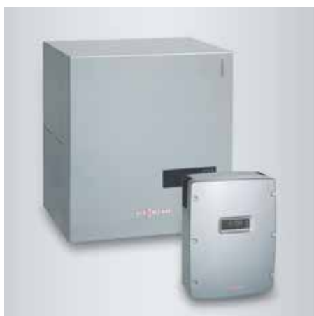
Système de stockage d'électricité (Type LAA)