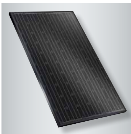
Module photovoltaïque monocristallin Vitovolt 300 avec cadre anodisé en noir et film sombre en tedlar