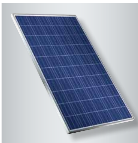
Module photovoltaïque polycristallin Vitovolt 300 avec 48 ou 60 cellules dans des dimensions compactes