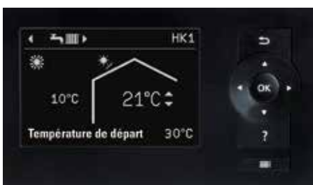
Régulation de pompe à chaleur Vitotronic 200 en fonction de la température extérieure (type WO1C)