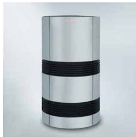
Vitocal 300-A pour installation extérieure

Il est possible de réaliser des économies supplémentaires sur les coûts de fonctionnement en raccordant une installation photovoltaïque. L'électricité auto-générée peut servir par exemple au fonctionnement du compresseur, de la régulation, des pompes et du ventilateur de la Vitocal 300-A. De plus, la Vitocal 300-A est préparée pour le Smart Grid.