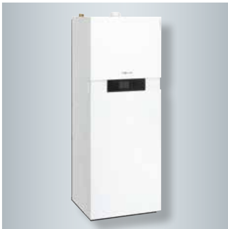
Pompe à chaleur hybride compacte Vitocaldens 222-F