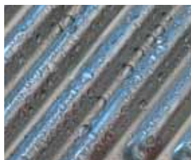
Surface d'échange Inox-Crossal en acier inoxydable

Avec une pression de service générale de 6 bars, la chaudière gaz à condensation de moyenne puissance Vitocrossal 200 (CM2B) offre une utilisation encore plus flexible pour l'alimentation en chaleur fiable des grands immeubles d'habitation ainsi que des entreprises industrielles.