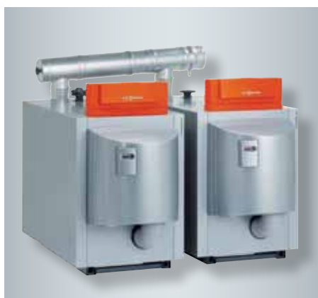
Installation à deux chaudières avec Vitocrossal 200 jusqu'à 622 kW