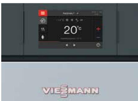
Vitotronic 200 – régulation intégrée pour les chaudières