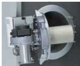
Brûleur cylindrique MatriX