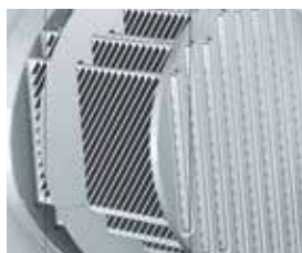
Surface d'échange de chaleur Inox-Crossal pour un transfert de chaleur très efficace et une vitesse de condensation élevée

La nouvelle chaudière gaz à condensation Vitocrossal 200 définit de nouveaux critères en termes d'entretien et de maintenance.