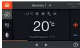
Vitotronic 200 – Commande intuitive grâce au grand écran tactile couleur

La nouvelle chaudière gaz à condensation Vitocrossal 200 définit de nouveaux critères avec le brûleur à disque MatriX et les surfaces d'échange de chaleur Inox-Crossal.