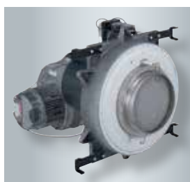
Brûleur à disque MatriX compact

Par rapport au modèle précédent, la chaudière gaz à condensation Vitocrossal 200 (type CRU) proposée dans des puissances de 800 et 1000 kW présente de nombreuses améliorations. Elle dispose notamment d'une plage de modulation étendue à 1:6 et de dimensions fortement réduites. Cela facilite considérablement la mise en place, en particulier lors des rénovations où les possibilités de remplacement des chaudières puissantes sont souvent limitées en raison des espaces restreints.