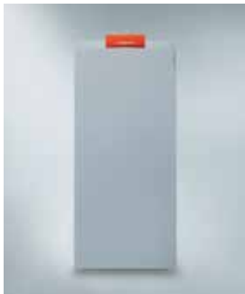
Vitocrossal 300 (CU3A)