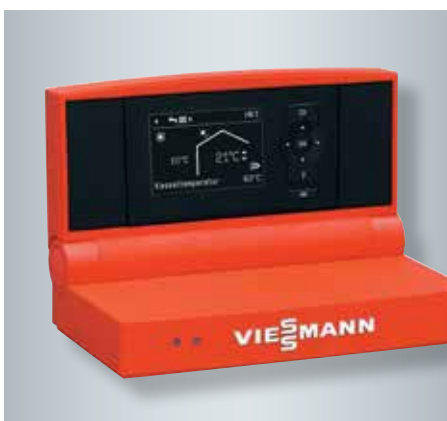
Régulation Vitotronic 200 à guidage par menu clair