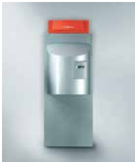
Vitocrossal 300 (CM3)