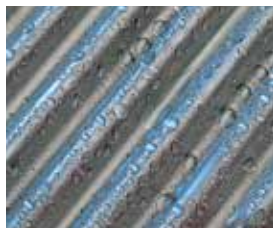
Surface d'échange Inox-Crossal en acier inoxydable