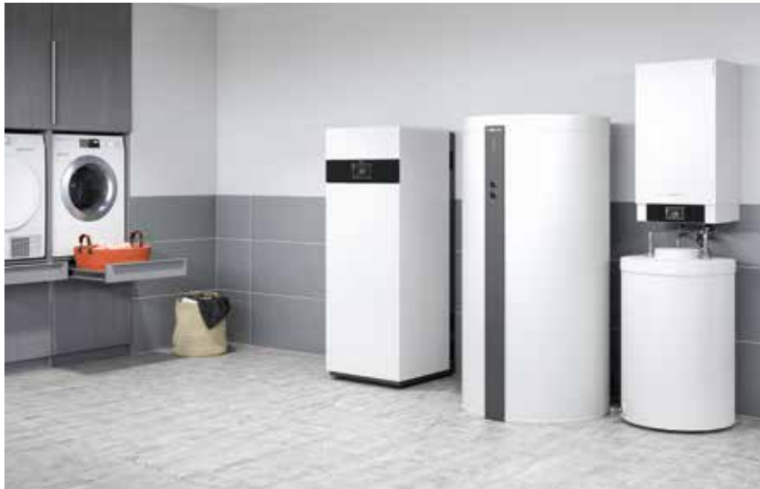
La pile à combustible Vitocalor PA2 - le complément idéal pour une installation de chauffage existante

Technique de pile à combustible éprouvée pour la production d'électricité dans les maisons individuelles et petits immeubles à appartements