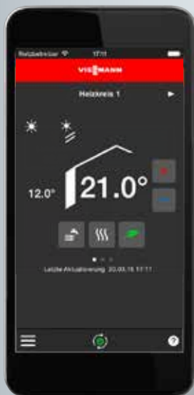
Confort d'affichage sur smartphone (iOS et Android).