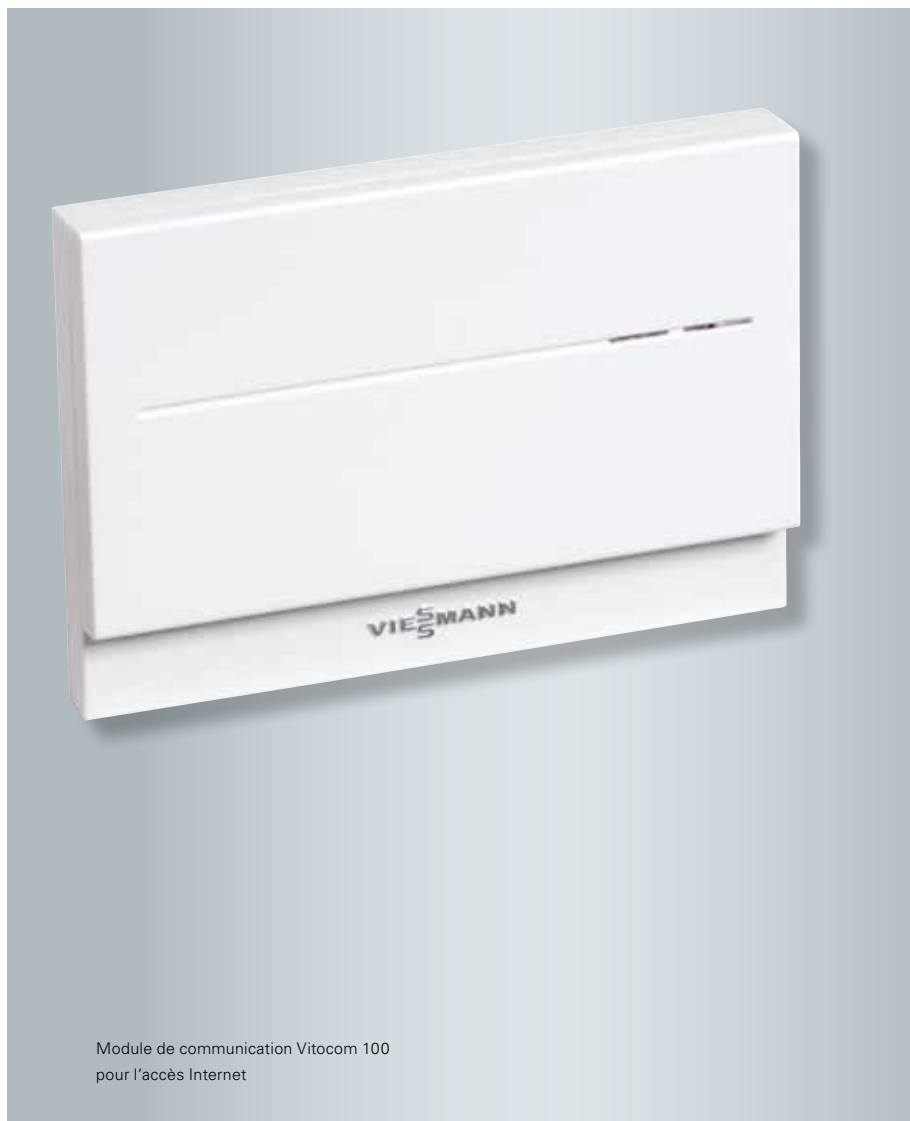
Module de communication Vitocom 100 pour l'accès Internet

Vitogate 200 est une passerelle KNX avec régulation de la température de départ intégrée à raccorder aux régulations Vitotronic via le bus LON.