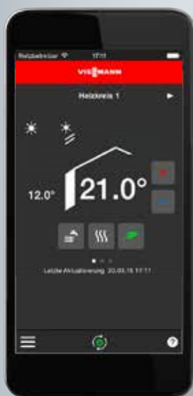
Confort d'affichage sur smartphone (iOS et Android).