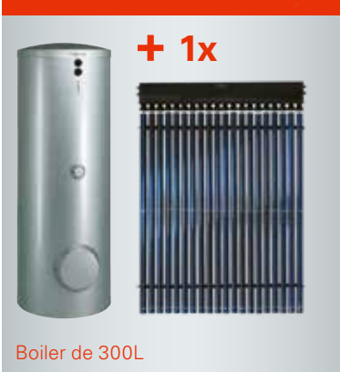
Boiler de 300L

4125 € HTVA, hors système de fixation et hors frais d'installation