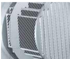
Inox-Crossal-warmtewisselaarsoppervlak voor een zeer efficiënte warmteoverdracht en condensatiebenutting