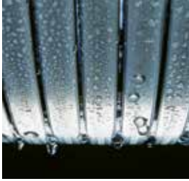
Inox-Radial-warmtewisselaar – duurzaam en efficiënt

Het condensatiewandtoestel op gas Vitodens 050-W biedt hoog verwarmings- en tapwatercomfort en een bijzonder gunstige prijs-/prestatieverhouding.