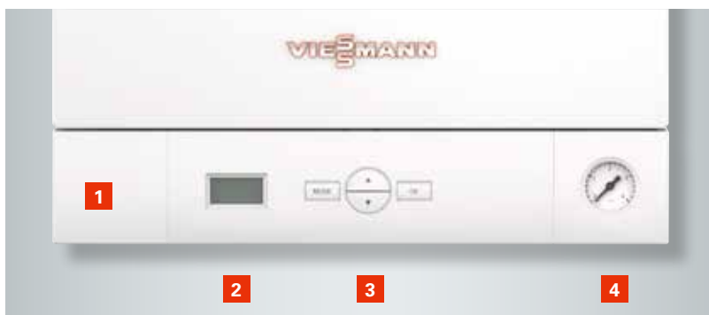
Regeling met geïntegreerd diagnosesysteem