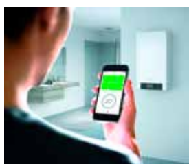
Bediening van de verwarmingsinstallatie via de ViCare-app