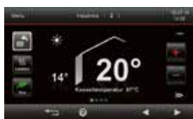
Vitotronic 200-regeling met touchscreen met kleurendisplay

* Voorwaarden en productoverzicht op www.viessmann.be