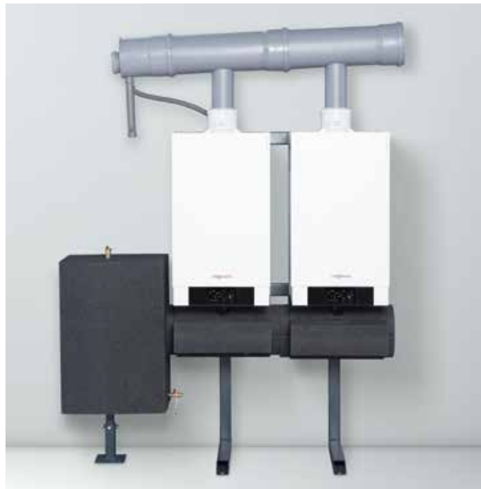
Volledig voormonteerde cascademodule voor wand- of vrijstaande montage, met opstelling in rijen en blokken

Modulair cascadesysteem voor meergezinswoningen, industriële toepassingen en openbare ruimten