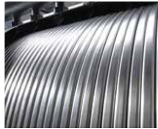
Inox-Radial-warmtewisselaar van roestvast staal

Roestvast staal maakt het verschil. De corrosiebestendige Inox-Radial-warmtewisselaar van roestvast staal vormt het hart van de Vitodens 200-W. Hij zet de gebruikte energie uitermate efficiënt om in warmte. Vrijwel zonder verlies, met een bijna niet te overtreffen rendement van 98 procent. En tegelijkertijd met de zekerheid van het bijzonder duurzame en hoogwaardige roestvast staal.