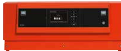
Cascaderegeling Vitotronic 300-K

Voor de regeling van het cascadesysteem kan de Vitotronic 300-K worden voorgesteld. De duidelijke en grafisch ondersteunde tekstweergave zorgt voor een hoog bedieningscomfort. Indien gewenst, kan de verwarmingsinstallatie via Vitogate 200 ook in systemen voor gebouwautomatisering worden geïntegreerd.