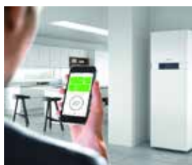
Bediening van de verwarmingsinstallatie via de ViCare-app