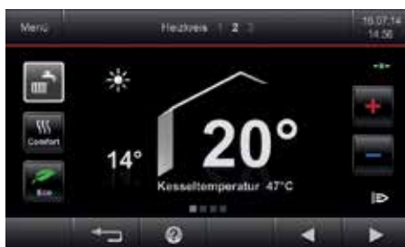
Vitotronic regeling met touchscreen-kleurendisplay