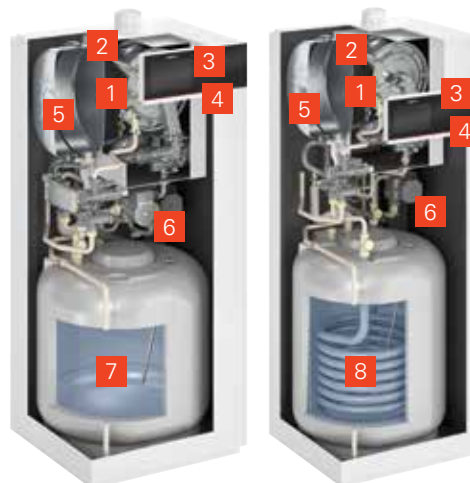
Vitodens 222-F met geëmailleerde laadboiler (type B2TE)