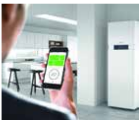
Bediening van de verwarmingsinstallatie via de ViCare-app