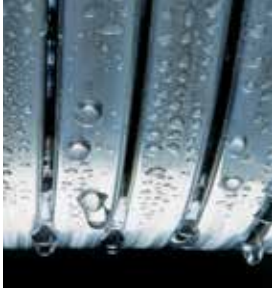
Inox-Radial-warmtewisselaar – duurzaam en efficiënt