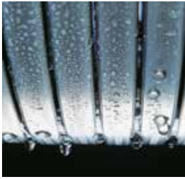
Inox-Radial-warmtewisselaar – duurzaam en efficiënt