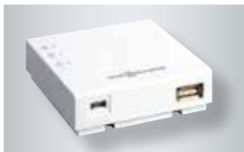
Vitoconnect met aansluitingen voor de stekkeradapter (links) en voor de dataverbinding

* Voorwaarden en productoverzicht op www.viessmann.be