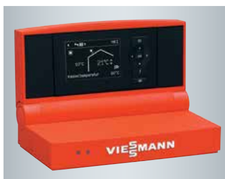
Vitotronic-regeling met overzichtelijke menu's