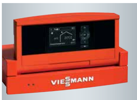
Vitotronic 200 regeling met overzichtelijke menu's