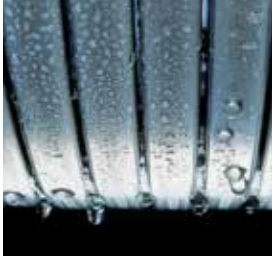
Inox-Radial-warmtewisselaar – duurzaam en efficiënt