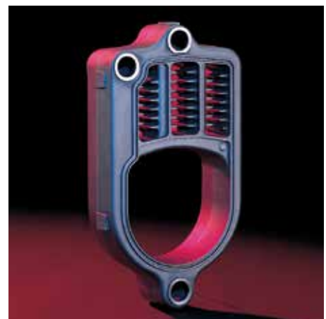
Het Eutectoplex-verwarmingsoppervlak garandeert een grote bedrijfszekerheid en een lange levensduur.

De Vitorondens 200-T van 20,2 tot 35,4 kW is ook beschikbaar met de constante regeling Vitotronic 100.