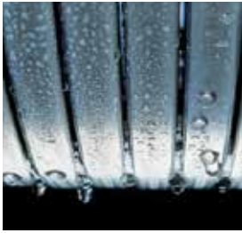
Inox-Radial-warmtewisselaar- duurzaam en efficiënt