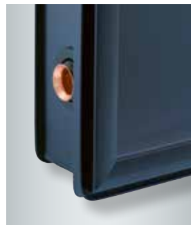
Collectorframe met speciaal inbouwprofiel voor integratie in het dakbedekkingsframe

ThermProtect zorgt bij de Vitosol 200-FM, vergeleken met traditionele vlakke collectoren, ook voor een hogere opbrengst, want deze collector gaat nooit in stagnatiefase en kan op ieder ogenblik terug warmte leveren.