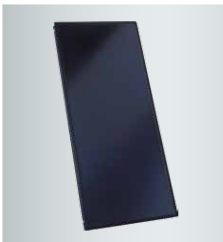
Vlakke collector Vitosol 200-FM