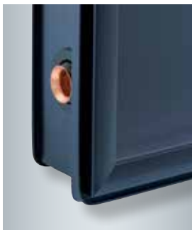
Collectorframe met speciaal inbouwprofiel voor integratie in het dakbedekkingsframe