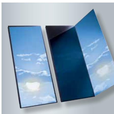
Vlakke collector Vitosol 200-FM met ThermProtect wisselende absorbercoating