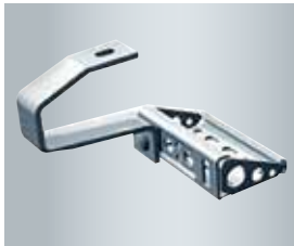
Eenvoudige en stevige montage van de collector dankzij spanthaken

De Vitosol 300-T van Viessmann is een vacuümbuiscollector met hoog rendement die beantwoordt aan de strengste vereisten met betrekking tot efficiëntie en veiligheid.