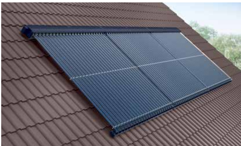
Universeel inzetbaar dankzij plaats-onafhankelijke montage, verticaal of horizontaal, op daken en gevels, maar ook vrijstaand

Dankzij de 'droge koppeling' kunnen de buizen bij onderhoudswerken snel en eenvoudig vervangen worden, ook als de installatie gevuld is.