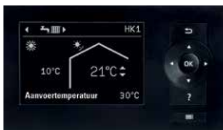
Display van de warmtepompregeling Vitotronic 200