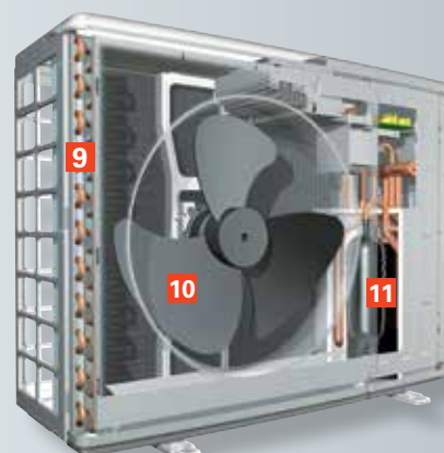
Vitocal 242-S/222-S Buitenmodule