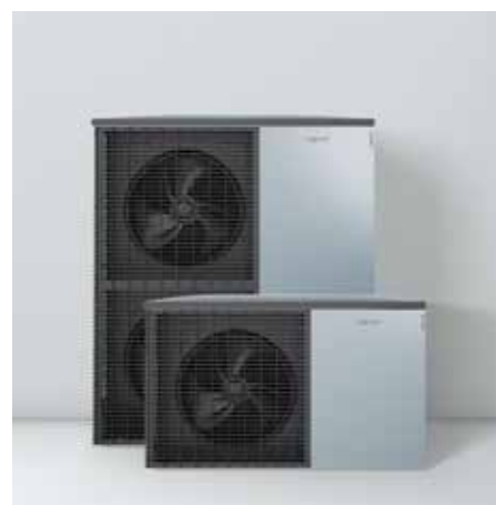
Buitenunits in Viessmann-design: Made in Germany

De regeling heeft een eenvoudige en intuïtieve bediening. Met de Vitoconnect-webinterface (toebehoren) en de gratis ViCare-app kan het systeem ook op afstand via smartphone bediend worden. En daarenboven kan de installatie, mits toestemming van de gebruiker, ook online via de Vitoguide-software door een verwarmingsspecialist opgevolgd worden. Warmtepompen die aangesloten zijn via de Vitoconnect webinterface genieten van 5 jaar garantie.