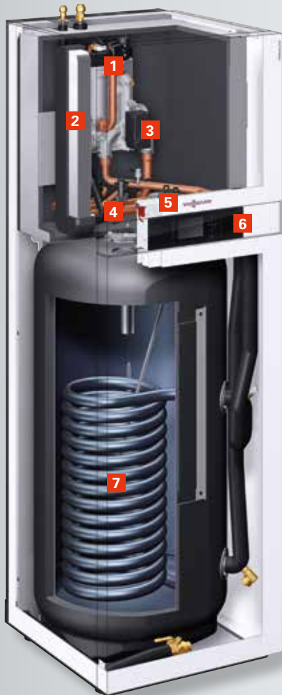
Vitocal 222-S Binnenunit