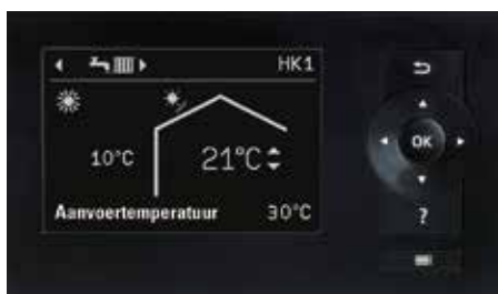
Display van de warmtepompregeling Vitotronic 200