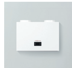
Vitocal 262-A wandmodule Type T2W-ze