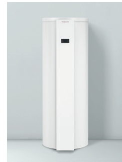
Vitocal 262-A Types T2E-ze/T2H-ze