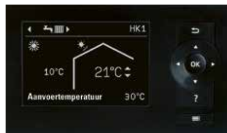
Display van de warmtepompregeling Vitotronic 200

De 5 jaar garantie van Viessmann is geldig op alle warmtepompen met Vitotronic 200 regeling, die sinds januari 2017 werden geplaatst en die binnen de 6 maanden werden aangesloten met Vitoconnect. Een onderhoudscontract is een vereiste.