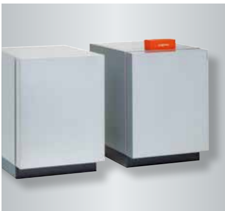
Tweetraps Vitocal 300-G als grond/water- of water/water-warmtepomp