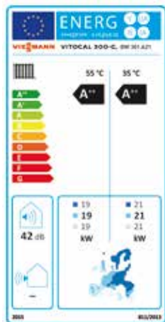
Energie-efficiëntielabel Vitocal 300-G, BW 301.A21