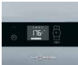
Ecotronic 100-regeling met verlichte display voor een eenvoudige en intuïtieve bediening

De Vitoligno 150-S is een compacte en aantrekkelijk geprijsde kloofhoutvergassingsketel die zowel monovalent als bivalent (aanvullend op de verwarmingsinstallaties op stookolie en gas) kan worden gebruikt.