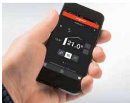
Vlotte bediening via Viessmann-app op uw smartphone vanuit de woonkamer

De Vitoligno 150-S met 30 kW-vermogen heeft een modulerende werking en past zich traploos aan de actuele warmtebehoefte aan.