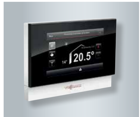
Afstandsbediening Vitotrol 350 met touchscreen voor woonkamers

Dankzij de touchscreen Vitotrol 350 kan de houtvergassingsketel ook vanuit de woonkamer bediend worden. Het grote 5-inch display in formaat 16:9 zorgt voor een uiterst eenvoudige bediening. Alternatief kan ook er ook voor gekozen worden om de in de ketel geïntegreerde bediening te vervangen door een touchscreen.