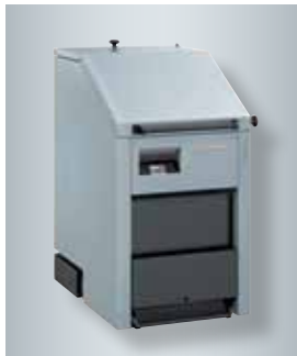
Kloofhoutketel voor blokken van een halve meter Vitoligno 250-S, 40 tot 75 kW

De Vitotrol 350 afstandsbediening met touchscreen werd in 2014 door het Design Centrum Nordrhein-Westfalen bekroond met de red dot design award.