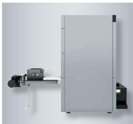
Vitoligno 300-H (50 tot 60 kW) met brandstoftoevoer aan de achterkant voor een flexibele en plaatsbesparende opstelling

Vitoligno 300-H – voor het automatisch vullen met houtsnippers of houtpellets