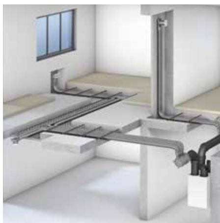
Makkelijke plaatsing in de dekvloer

In overeenstemming met onze filosofie worden alle componenten door Viessmann geleverd.