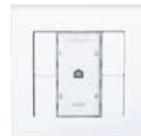
4-trapsknop met indicator voor filtervervanging