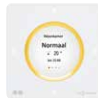
Vitoltr 300-E Comfortabele draadloze afstandsbediening als toebehoren