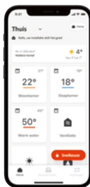
ViCare-app Regeling van het complete energiesysteem

Optioneel kan aan de verwarmingsspecialist toestemming worden gegeven om het systeem op afstand te monitoren, zodat een storing meteen online of via een snelle onderhoudsbeurt kan worden verholpen.