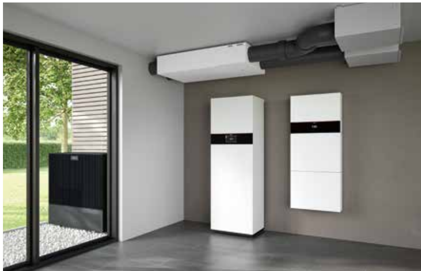
Woningventilatiesysteem Vitoair FS met lucht/water-warmtepomp Vitocal 252-A en stroomopslagsysteem Vitocharge VX3

▾ Het centrale woningventilatiesysteem Vitoair FS zorgt overal in huis voor een gezond binnenklimaat en aangename temperaturen.