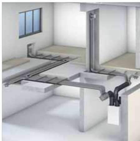
Luchtverdeelsysteem voor het Vitovent 300-W woningventilatiesysteem

Vochtige binnenlucht is een van de hoofdzaken van schimmelvorming. Schimmel is ook schadelijk voor de gezondheid van de bewoners en leidt tot blijvende gebouwschade. Investeren in een woningventilatiesysteem is voordeliger dan gebouwschade door schimmelvorming te moeten herstellen.