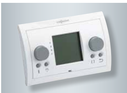
Afstandsbediening voor Vitovent 300-W

Vitovent 300-W tot 300 m 3 /h en tot 400 m 3 /h